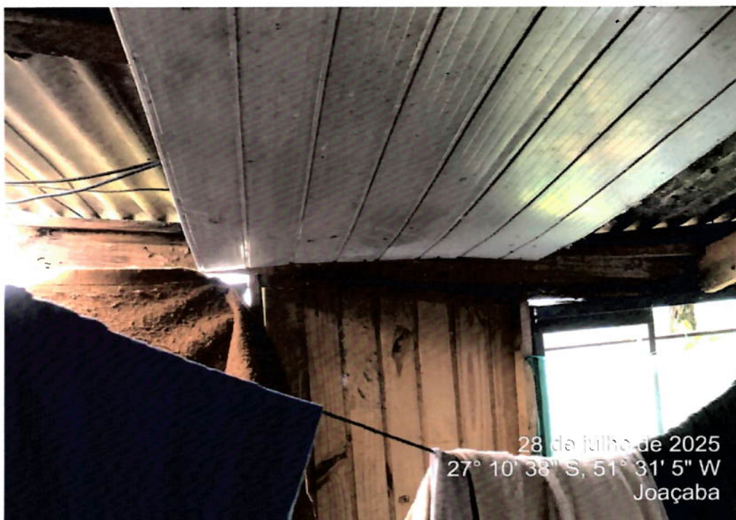
Foto 4 – Vista da inclinação das paredes e abaulamento do telhado