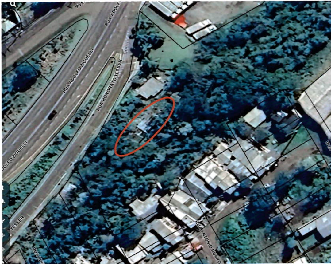
Figura 1 – Local da Vistoria